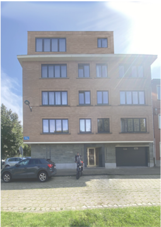
intégration photo vue de la façade - square des cicindèles 9