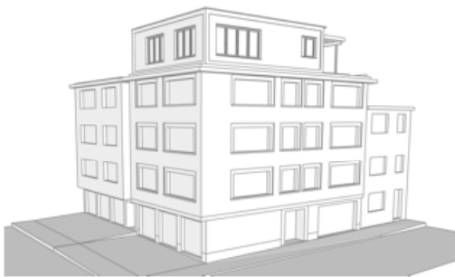
vue axonométrique à l'angle