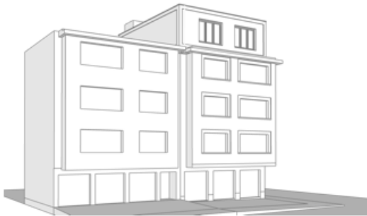
vue depuis la rue des archives