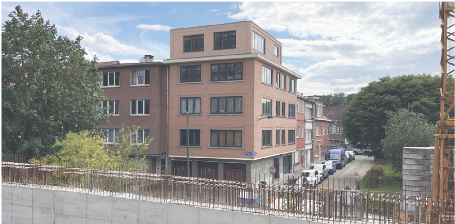
intégration photo vue depuis l'angle- square des cicindèles 9