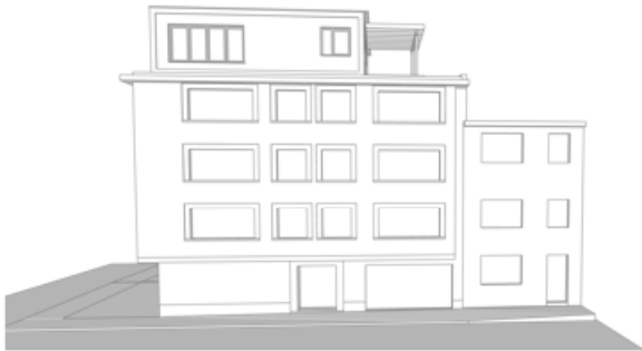
vue depuis le square des cicindèles